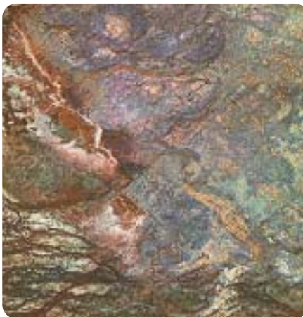
▲ Fotografija Marsa snimljena iz svemira