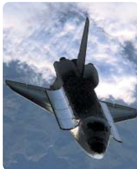
▲ Hoće li space shuttle ikada otići na Mars?

Uz spomenute letjelice Mariner, najveći uspjeh donio je projekt Viking 1976. godine, kada su dvije letjelice ušle u orbitu Marsa i spustile dva landera s kamerama na površinu. Premda se sa stajališta današnjeg tehnološkog razvoja sam lander smatra zastarjelim, a tehnologija koju je nosio najblaže rečeno muzejskom, ipak je samo uspješno sletanje na Mars velika stvar. Lander je bio statičan, bez pogona, s dodanom robotskom rukom za analizu materijala u neposrednoj blizini. Naglasak istraživanja landera bio je na analizi atmosfere i tla Marsa, kojeg je nadgledalo naizgled jednostavno računalo sa zadatkom dvosmjerne komunikacije: slanja prikupljenih informacija na Zemlju na obradu i korekcija u istraživanju prema primijenjenim uputama sa Zemlje. Premda je projekt Viking bio izuzetno uspješan, NASA-in projekt izlaska iz Sunčevog sustava Voyager i početak ere space shuttle ova gurnuo je interes za istraživanje Marsa u stranu do 1989. godine. Tada je George Bush stariji, prigodom proslave 20. obljetnice slijetanja na Mjesec, dao NASA-i u zadatak da napravi plan slanja čovjeka na Mars. Rezultat je bio tzv. 90 Day Report, preliminarni plan predstavljen, pogađate, 90 dana kasnije. Sam plan je bio izrazito ambiciozan i predvidio je razdoblje od 30 godina za izgradnju orbitalnih hangara, trans-