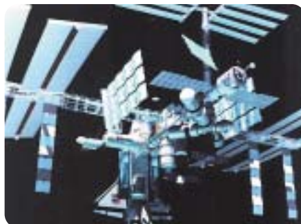
▲ Internacionalna svemirska stanica