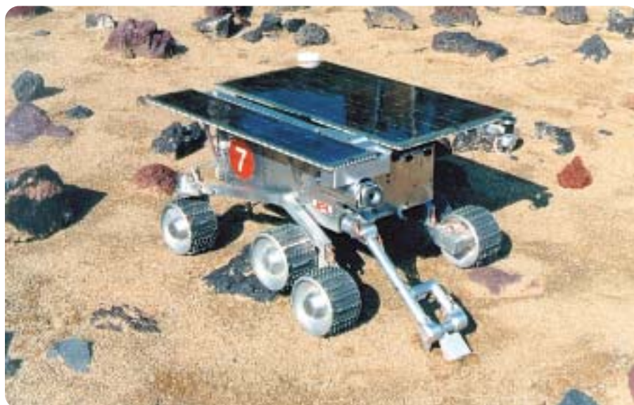
▲ Što skriva Mars tek treba otkriti

druga sfinge. Budući su se u istraživanjima stalno pojavljivale matematičke konstante "e" i "pi", bilo je sve više onih koji su u tome vidjeli poruku izvanzemaljske inteligencije. Što točno predstavlja Lice , radi li se ipak samo o iluziji ili je u pitanju zaista umjetna građevina, ostaje nepoznato. Pri tome NASA nimalo ne pomaže, jer sve istraživačke letjelice poslane u devedesetima i tijekom zadnjih godina, nisu i neće proći iznad Cydonije. U NASA-i tvrde da je razlog tome jednostavan - tamo nema ničeg zanimljivog. Odgovor na to pitanje najvjerojatnije će dati prva ljudska misija na Mars. Premda se još ne zna kada će prvi čovjek stupiti na Crveni planet, planovi za takvu misiju postoje odavno, još od pedesetih godina 20. stoljeća.