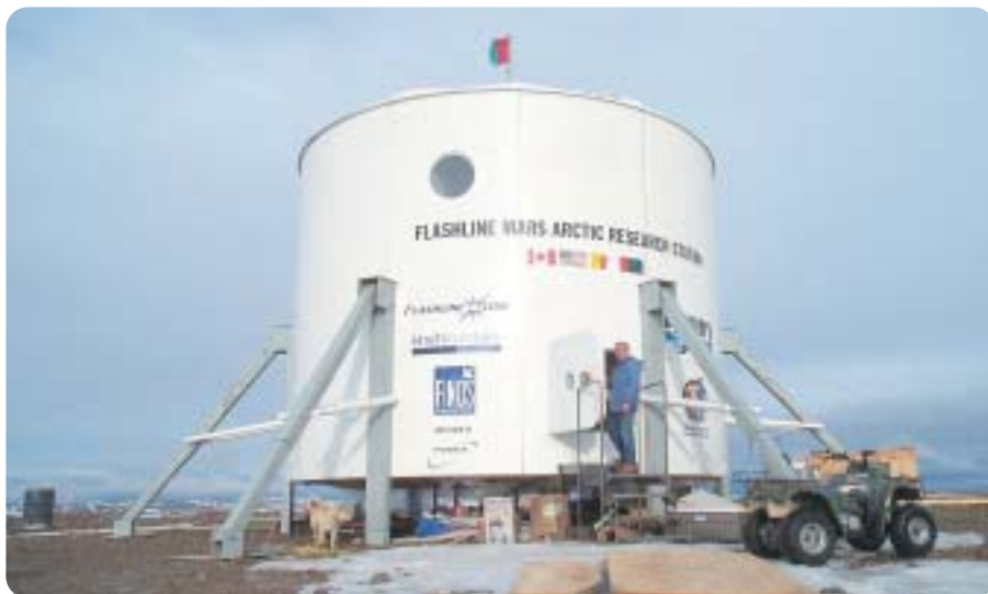
▲ Prototip marsovskog habitata, trenutno na testiranju na Arktiku