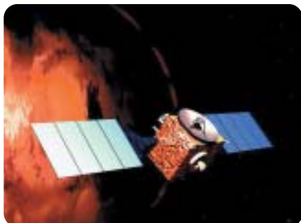
▲ Mars Express

Prvo se na Mars šalje letjelica koja prevozi letjelicu za povratak na Zemlju, ERV (Earth Return Vehicle), vozilo s malim nuklearnim reaktorom, te 20 tona vodika, opremu za njegovu kemijsku preradu i atmosferske kompresore. Jednom kad letjelica sleti na Mars, energija reaktora počinje napajanje atmosferskih kompresora, koji će skupljati ugljični dioksid iz atmosfere. Taj se plin kombinira s donesenim vodikom, a njihova reakcija proizvodi metan i vodu. Metan se sprema u ERV tankove, dok voda ulazi u proces elektrolize, kojim se rastavlja na kisik i vodik. Kisik se također sprema u tankove, a u kombinaciji s metanom služi kao izvrsno pogonsko gorivo. Višak kisika bi služio kao izvor zraka za budući habitat. Vodik koji ostaje u procesu elektrolize ponovo se kombinira s ugljičnim dioksidom i