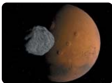
▲ Mars i mjesec Fobos

Prva histerija zvana Mars počela je prije više od 100 godina, kada je Talijan Giovanni Schiaparelli na površini Marsa opazio gustu mrežu prirodnih kanala, koje je nazvao talijanskom riječju canali . Smatrao je da su oni ostaci riječnih tokova. No kako Schiaparelli nije bio vješt u engleskom jeziku, u prijevodu svog rada upotrijebio je riječ canal , koja označava ljudskim radom stvoren vodeni put. To je bilo dovoljno ekscentričnom američkom bogatašu Percivalu Lowellu da u Arizoni sagradi opservatorij i posveti se istraživanju Marsa i potrazi za životom na njemu. Nakon 13 godina Lowell je zaključio da su kanali na Marsu previše linearni da bi bili prirodni - oni su zapravo kanali za navodnjavanje